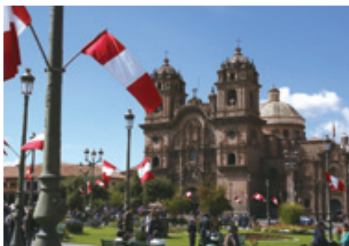
クスコ／かつてインカ帝国の首都だったクスコは、マチュピチュへの遺跡観光の起点となる街です。また、クスコもマチュピチュと並び世界遺産に指定されています。標高は3,360m。