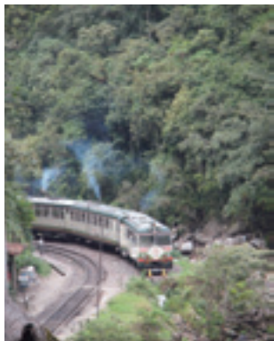
インカレイル／レトロな車両はビルカノータ川と共に蛇行しながら、雪山と雪山の間を、緑の耕作地の間を、縫うように進み、神秘的なマチュピチュがそびえ立つ魅惑の亜熱帯林地帯へと侵入していきます。