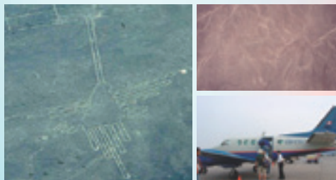
上左:地上絵「ハチドリ」 上右:地上絵「サル」