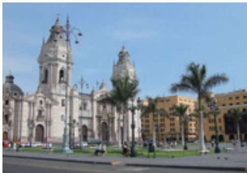
リマ(アルマス広場)／ペルーの首都リマは、太平洋に面したコストと呼ばれる乾燥大地に開けた大都市。ペルーの人口の約3分の1が生活する政治・経済の中心地でもあります。